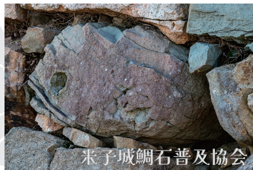
米子城鯛石普及協会

〈お問合せ先〉米子コンベンションセンター TEL 0859-35-8111 (9:00-18:00)